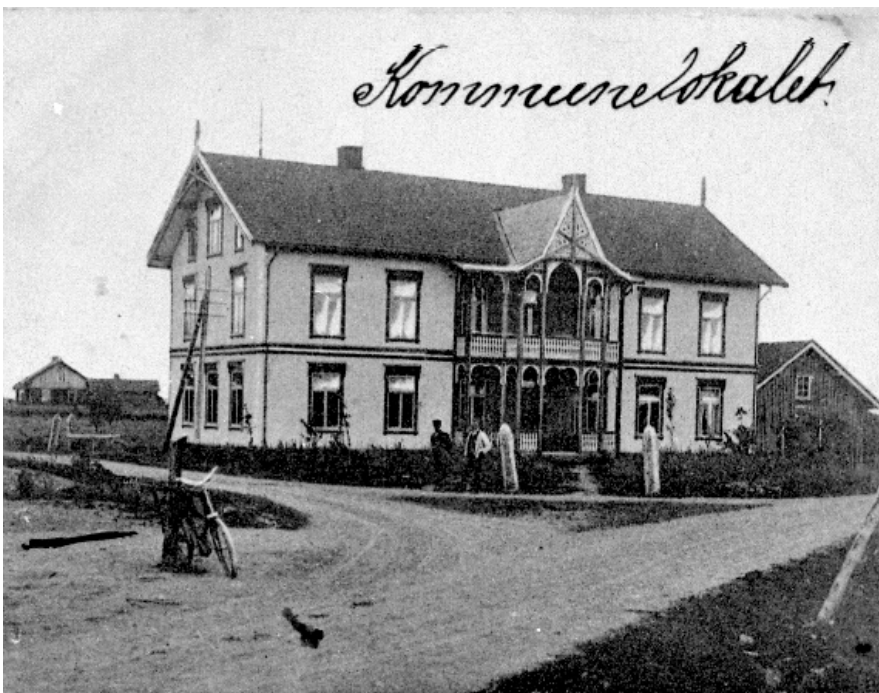
Våle kommunelokale, med markerte etasjeskiller, og veranda med utskjæringer.