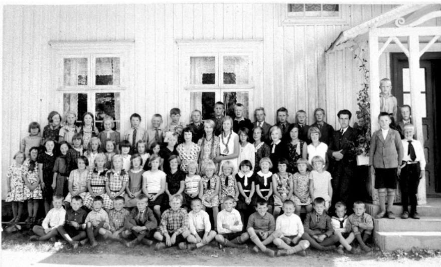
Skolebilde med barn og lærere ved Ormestad skole.